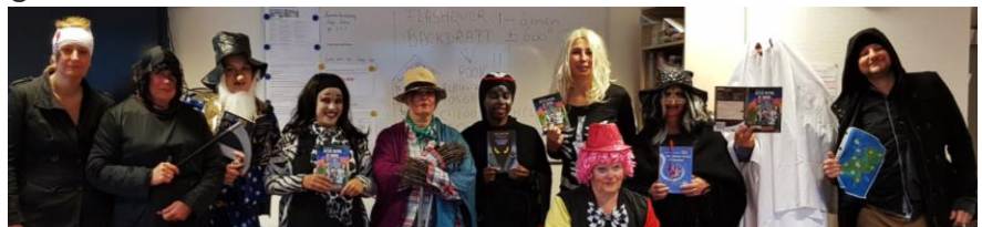
Foto: De centrale afsluiting van de kinderboekenweek met een vossenjacht in het Spinozapark. Op de foto onze vossen!

Afgelopen herfst hebben we met zijn allen gewerkt aan het thema van de kinderboeken week; 'Gruwelijk Eng'. De gezamenlijke opening met de videoclip die de meesters en juffen hebben gemaakt, heeft zelfs het jeugdjournaal gehaald!