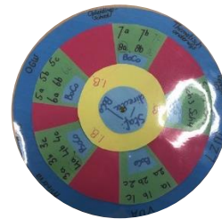
Een schematisch overzicht van onze nieuwe organisatie

Met deze organisatie hopen we het onderwijs aan uw kinderen (nog) beter te kunnen organiseren.